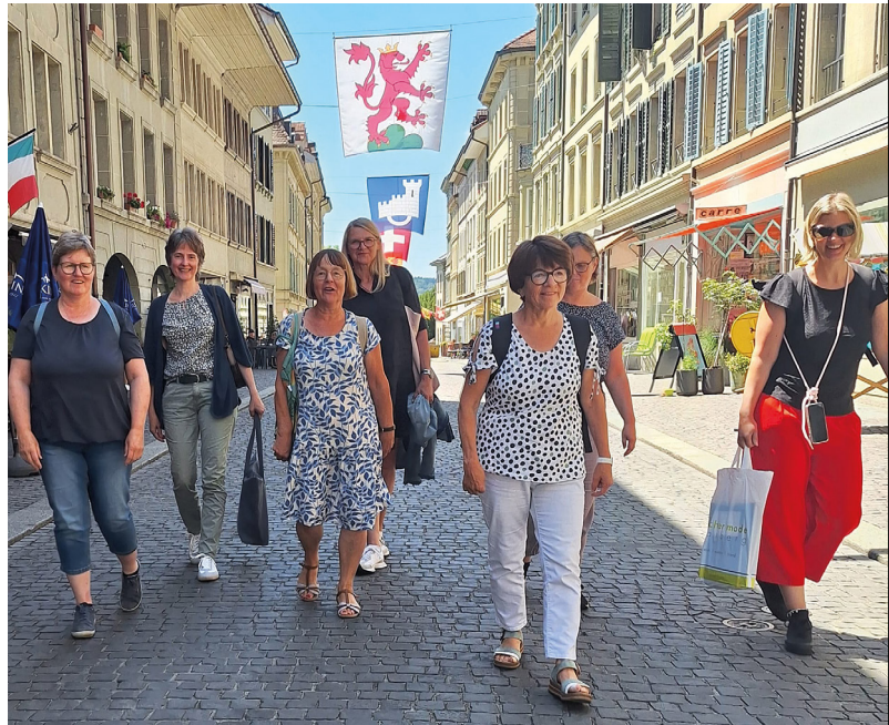
Klar, bei dem Wetter: Bestens gelaunt auf der Vorstandsreise in der Altstadt von Burgdorf

Der Vorstand traf sich zu drei Sitzungen. Die traditionelle Vorstandsreise führte diesmal nach Burgdorf, dem Wohnort der Präsidentin. Nach der Sitzung in einem Restaurant in der Altstadt und dem Mittagessen folgte