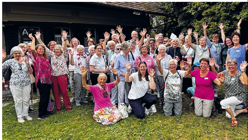
Der SGF Solothurn auf Vereinsreise in Ins: gemeinsame Erlebnisse stärken den Zusammenhalt unseres Netzwerkes

Besondere Erlebnisse bereicherten das Vereinsjahr und stärkten dabei den Zusammenhalt innerhalb unseres Netzwerks. Dies zeigte sich beim Vereinsausflug, der uns an den Bielersee und nach Ins ins Centre Albert Anker führte. Ebenso gut besucht war die Einladung ins Kino zum Film «Wir Frauen von Worb», der uns eindrücklich die Verbundenheit mit anderen Frauenvereinen der Schweiz vor Augen führte.