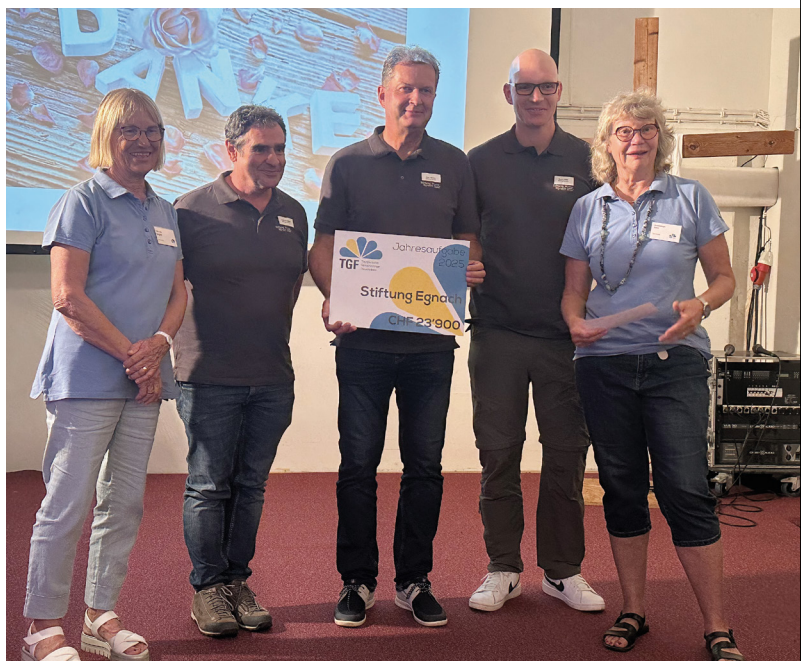
Durch die Spenden aller Sektionen kam ein stolzer Betrag zusammen, den wir der Stiftung Egnach als Check übergeben konnten